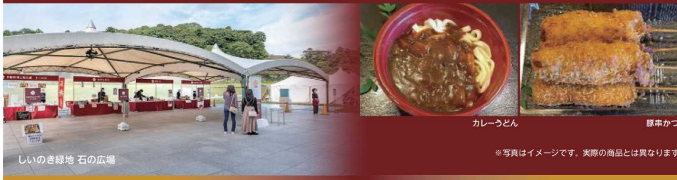
しいのき緑地 石の広場 カレーうどん 豚串かつ ※写真はイメージです。実際の商品とは異なります。

見て・触れて・香り・聴いて・味わう 金沢食文化フェスタ | ◎主催 = 金沢市(産業政策課) Tel.076-220-2204 http://gokan-gochisou-kanazawa.jp/ 金沢食文化フェスタ 検索