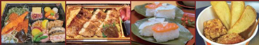
秋シャケといくらの四季彩弁当 うなぎ弁当 柿の葉寿司 若鶏の竜田揚げ<フライドポテト付>