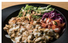
チキンオーバーライス 1,200円(税込)