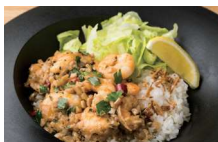
ガーリックシュリンプオーバーライス 1,200円(税込)

また、バターチキンカレー 1,200円(税込) の他、バターサンドクッキー 300円(税込)、国産レモンのNYチーズケーキ 500円(税込)、あんバターデニッシュドーナツ 300円(税込) など、豊富なデザートもご用意しています!